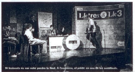
Ni lesonats es van voler perdre la final. A l'esquerra, el públic en una de les setmanals.